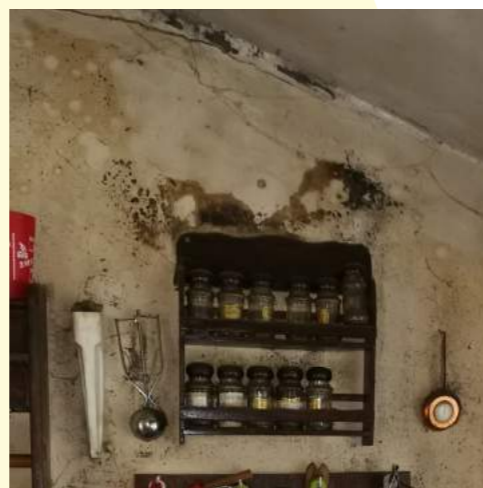
Avant les travaux